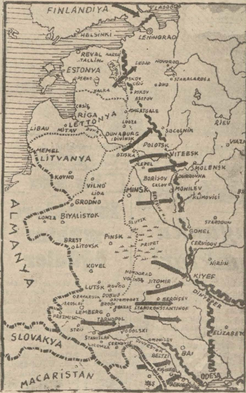
Alman ordularının vardıkları mevkiileri gösterir harita

Londra 14 (A.A.) — Kahireden - alınan bir habere göre Temmuz - un başlarında İskenderiyei terkeden - askerlerin adedi 90,000 i bul - duğudur. Bunlardan 60 binı yukarı - ya gönderilecektir.