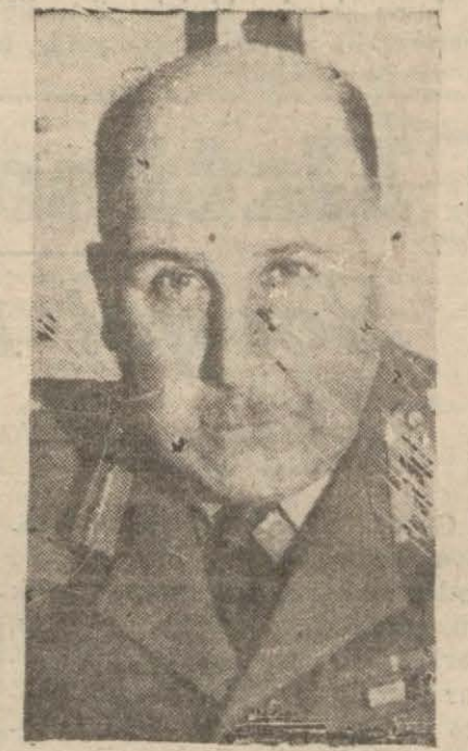
General Wilson Kahire 13 (A.A.) — Ortaşark İngiliz umumî karargâhının tebli - (Devamı 3 üncü sayfada)