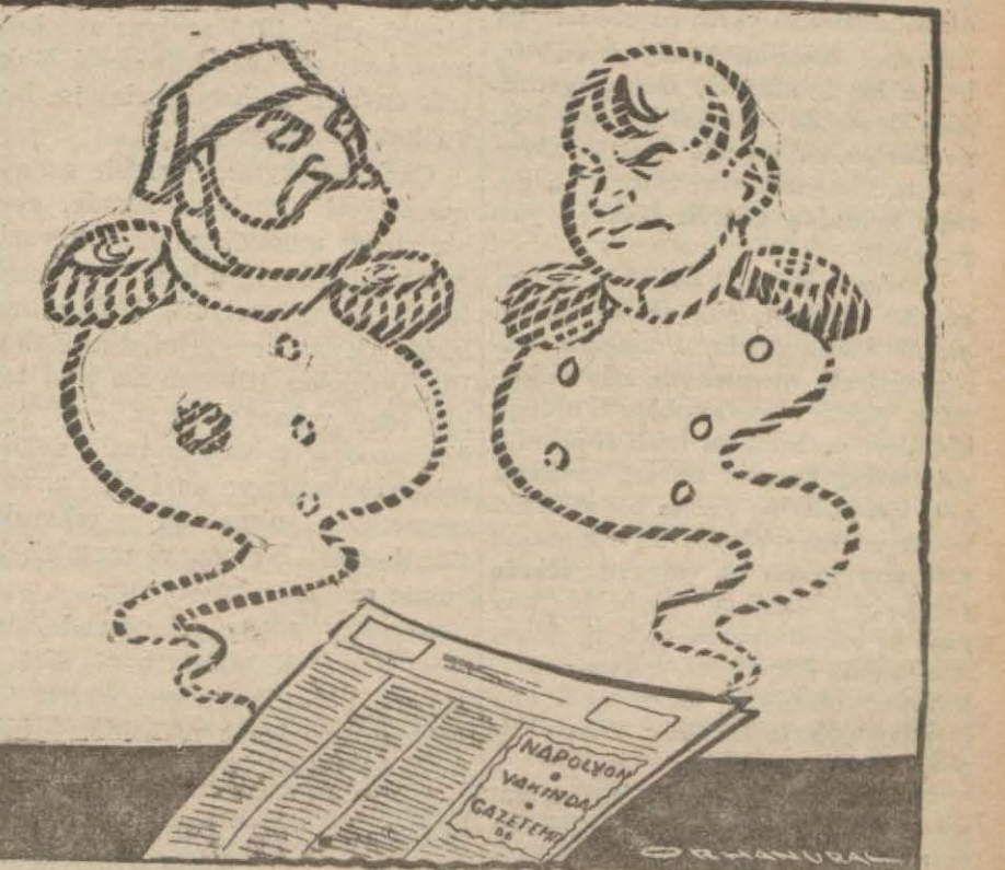
GAZETELERİMİZDEKİ TEFRİKALAR Napolyonun ruhu Abdülazizin ruhuna — Eğer benim Moskova seferim olmasaydı sen hâlâ ne intihar edecektin, ne de öldürülecektin!